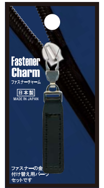
No.1230 合皮黒 標準小売価格：¥500 (税込¥550)