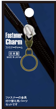
No.1223 サークルAG 標準小売価格：¥400 (税込¥440)