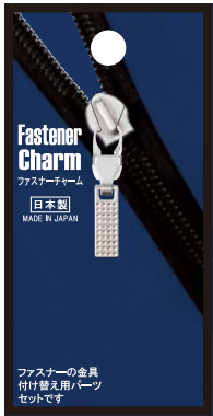
No.FCS-20 スクエアS N 標準小売価格：¥350 (税込¥385)