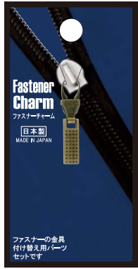
No.FCG-6 スクエアS AG 標準小売価格：¥350 (税込¥385)