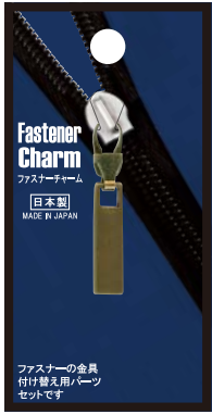
No.FCG-5 スクエアM AG 標準小売価格：¥400 (税込¥440)