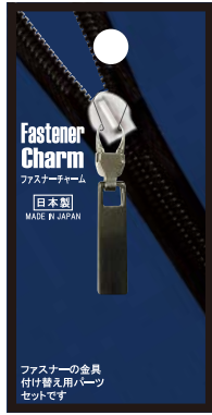
No.FCN-12 スクエアM BN 標準小売価格：¥400 (税込¥440)