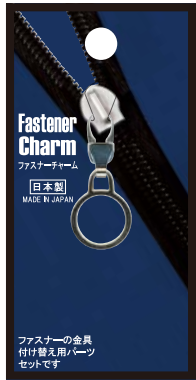
No.1222 サークルS 標準小売価格：¥400 (税込¥440)