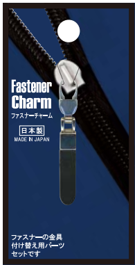
No.1226 ブラック 標準小売価格：¥350 (税込¥385)