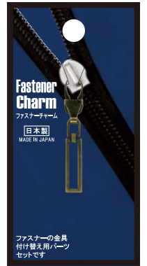
No.1225 スクエアAG 標準小売価格：¥400 (税込¥440)