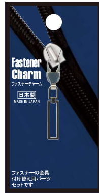
No.1224 スクエアS 標準小売価格：¥400 (税込¥440)