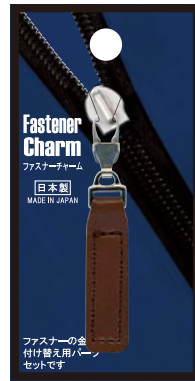
No.1229 合皮茶 標準小売価格：¥500 (税込¥550)