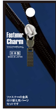
No.FCN-13 スクエアS BN 標準小売価格：¥350 (税込¥385)