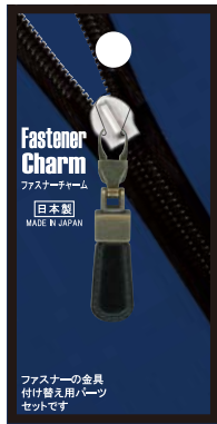
No.1228 革調黒 標準小売価格：¥400 (税込¥440)