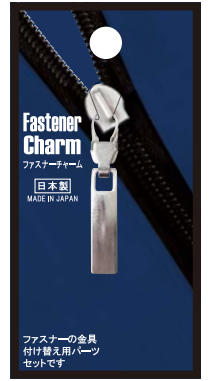
No.FCS-19 スクエアM N 標準小売価格：¥400 (税込¥440)