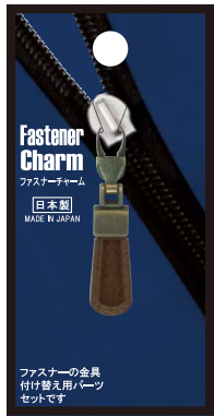
No.1227 革調茶 標準小売価格：¥400 (税込¥440)